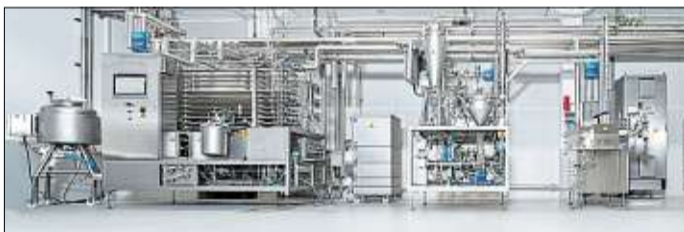
Am Krones Hauptsitz in Neutraubling wurde Anfang Mai ein neues Process Technology Center eröffnet.

Neutraubling. Vor wenigen Jahren eröffnete die Krones Tochtergesellschaft Steinecker in Freising ein Technology Center, in dem Kunden Rezepturen für Biere und Plant-based Drinks entwickeln und testen können. Nun setzt der Konzern einen weiteren Meilenstein in der Entwicklung von Getränken und Prozessen. Wie der Oberpfälzer Hersteller von Getränkeabfüllanlagen mitteilte, wurde Anfang Mai am Unternehmenssitz in Neutraubling mit dem Process